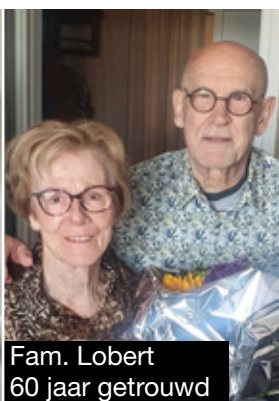
Fam. Lobert 60 jaar getrouwd