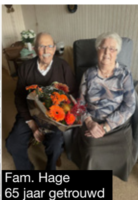
Fam. Hage 65 jaar getrouwd