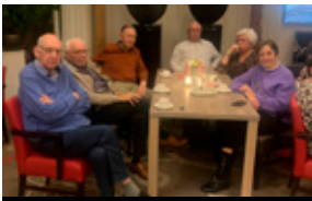
Bezoek Hugo de Jonge