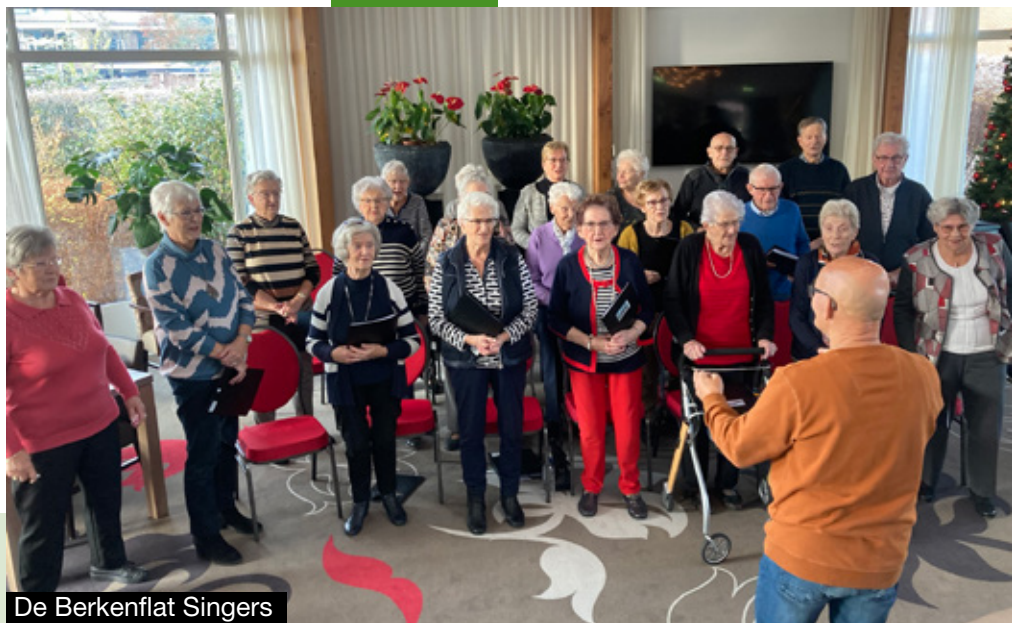
De Berkenflat Singers